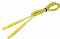
Cavi di prova 5 / 10 / 20 m (terminale banana) giallo