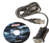
Cavo per trasmissione seriale RS-232