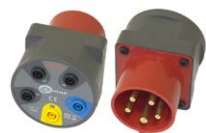
Adattatore presa trifase industriale 16 A / 32 A