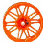
Bobina per avvolgere il cavo di prova