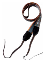
M1 cinghia di supporti