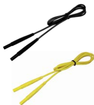
Cavi di prova 1,2 m (terminale banana) nero / giallo