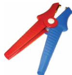
2x morsetto a coccodrillo Kelvin 1 kV 25 A