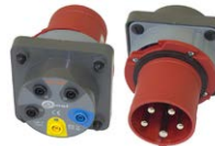
Adattatore presa trifase industriale 63 A